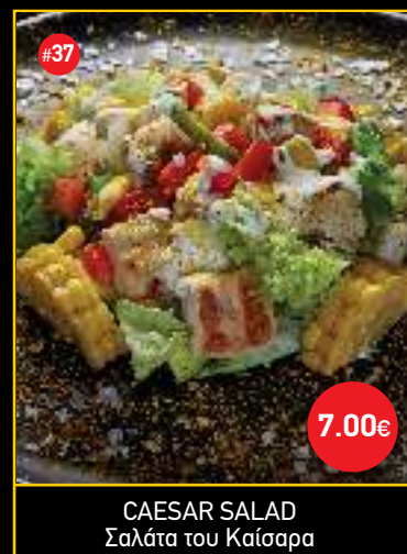
CAESAR SALAD Σαλάτα του Καίσαρα