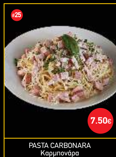
PASTA CARBONARA Καρμπονάρα