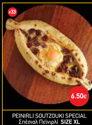
PEINIRLI SOUTZOUKI SPECIAL Σπέσιαλ Πείνιρλι SIZE XL