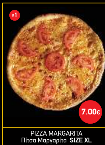
PIZZA MARGARITA Πίτσα Μαργαρίτα SIZE XL