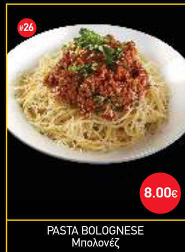
PASTA BOLOGNESE Μπολονέζ