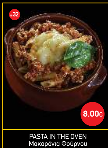
PASTA IN THE OVEN Μακαρόνια Φούρνου